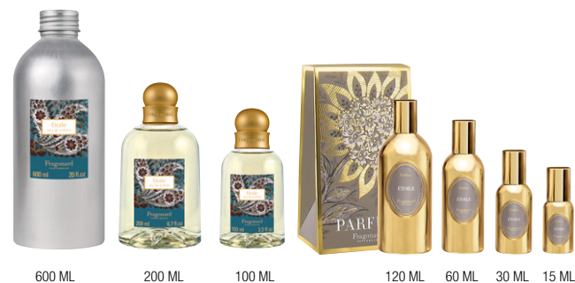
600 ML 200 ML 100 ML 120 ML 60 ML 30 ML 15 ML

5% de descuento En los Bidones recarga (600 ml) Válida hasta el 30/06/2023